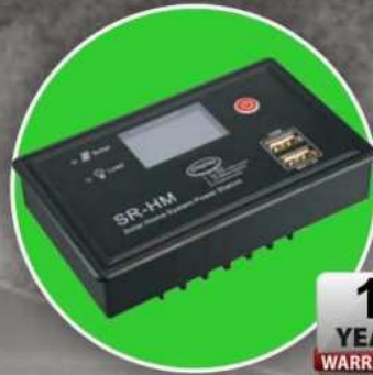
Solar Charge Controller