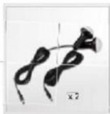
B Power Pack