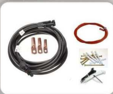
Kabel & Aksesoris