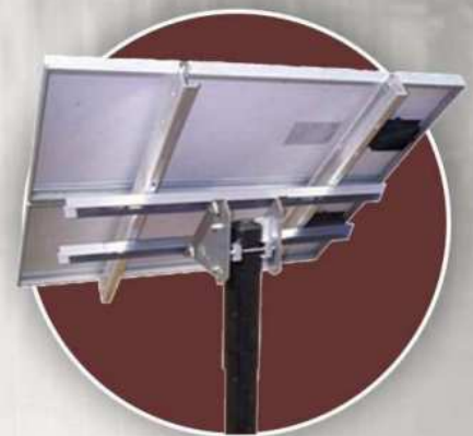
Bracket Modul Surya